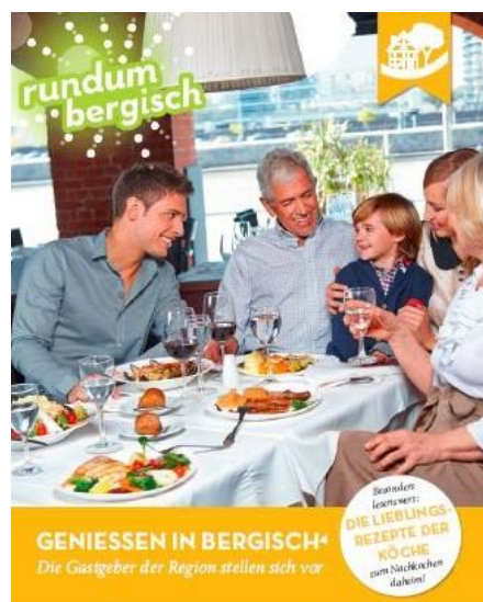
Foto: Schlemmerführer Titelblatt

Erfolgreiche Köche der Region verraten ihre Lieblingsrezepte und machen Lust auf einen Besuch in der Region bergisch 4 sowie auf das Nachkochen daheim.